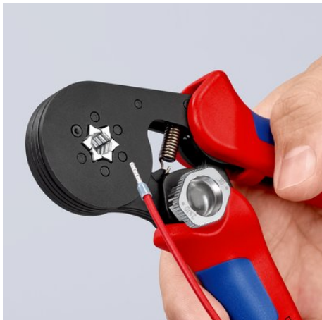
!Geeignet für feine Leiter: Crimpen von feinen Leitern ab 0,08 mm!