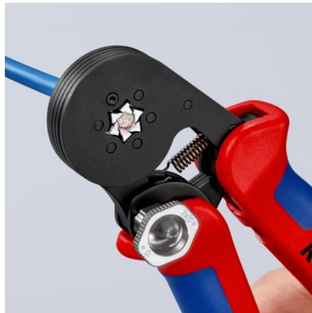
!Enorme Kapazität: Crimpen von Einzeladern bis zu 16 mm 2 oder Doppeladern bis zu 2 x 10 mm 2 !