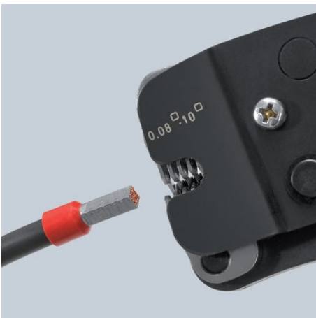
197 53 08 und 09: Vierkant-Crimp mit automatischer Größenanpassung!

Med reservation för tekniska ändringar och fel