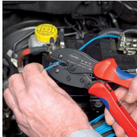
97 52 37