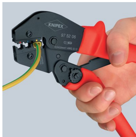
Andra steg: använd nu hela handen för att fortsätta pressningen