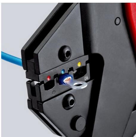
97 43 200 med pressbackar 97 49 06 för isolerade kabelskor, kontaktdon och skarvdon