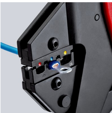
97 43 200 met krimpprofiel 97 49 06 voor geïsoleerde kabelschoenen, steekverbinders en stootverbinders