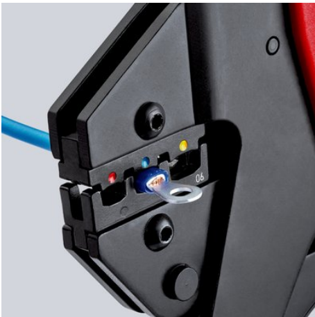
97 43 200 s lisovacím nástavcem 97 49 06 pro izolovaná kabelová oka, konektory a dvojitě spojky