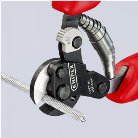
Knippen van zeer stevige draadkabels (1960 N/mm 2 ) tot Ø 4 mm