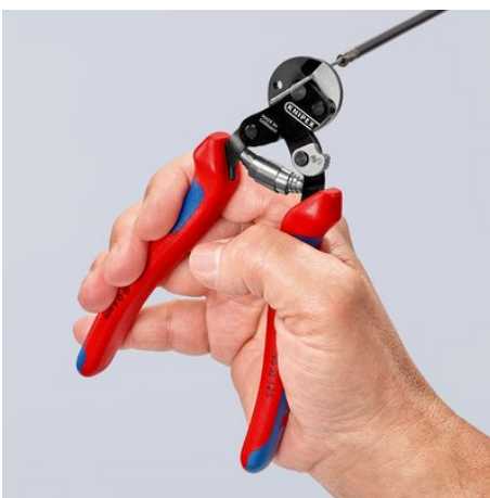
Met 160 mm compact en toch krachtiger dan vele grotere draadkabelscharen

Onder voorbehoud van technische wijzigingen en vergissingen