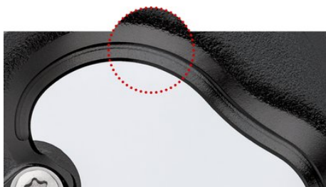
Přesně frézovaná a induktivně tvrzená hrana bříty