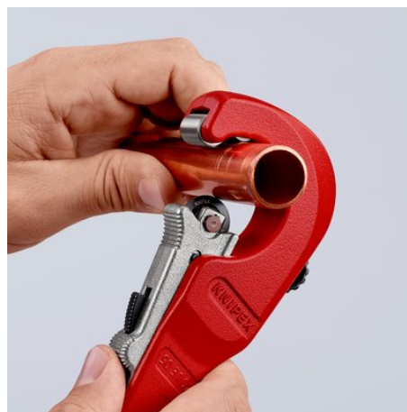
Empuje el disco de corte contra la tubería con la fijación rápida QuickLock con una sola mano: ajuste rápido para tuberías de diferentes diámetros