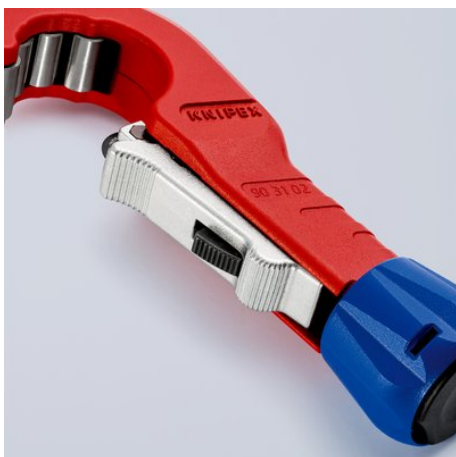
El disco de corte amortiguado se puede desplazar y fijar en el diámetro del tubo gracias a la fijación rápida con una sola mano