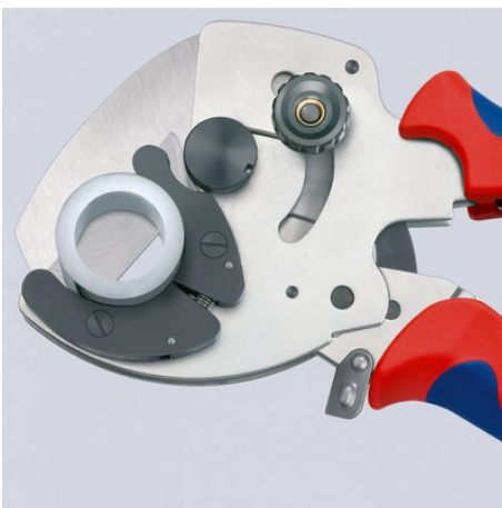
Exakt snitt av tjockväggade plast- och kompondrör

Med reservation för tekniska ändringar och fel