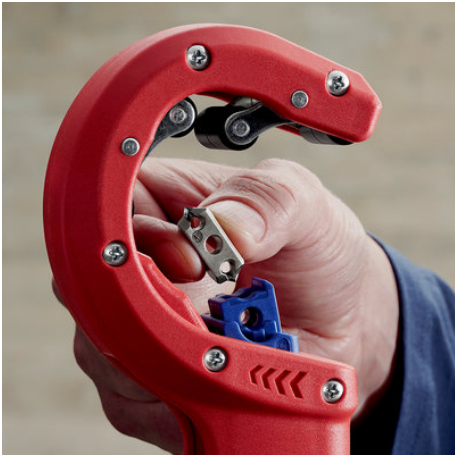
!Wenn die Klinge abgenutzt ist, kann sie ohne Werkzeug gewendet oder ausgetauscht werden!