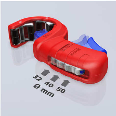
!Drei Durchmesser mit einem Werkzeug: Der Rohrdurchmesser lässt sich mit dem Metallversteller vor einstellen!