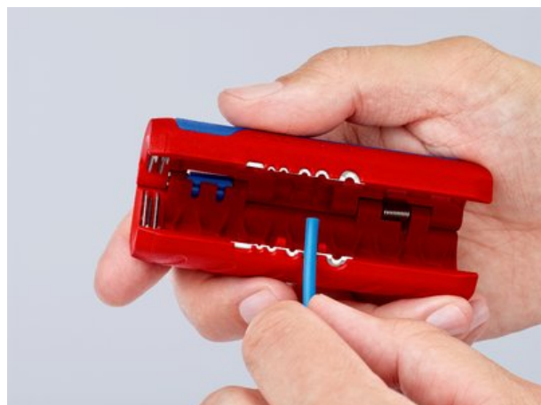
90 22 02 SB: Ingespoten lengteschaal voor gelijkmatig isoleren op een uniforme lengte, leesbaar voor rechts- en linkshandigen