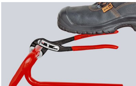
Samosvorné na trubkách a matkách: nehrozí sklouznutí po obrobku; veškerou sílu úchopu lze využít k natočení obrobku; pevný stisk ramen kleští není nutný, díky tomu stačí vynaložení menší síly