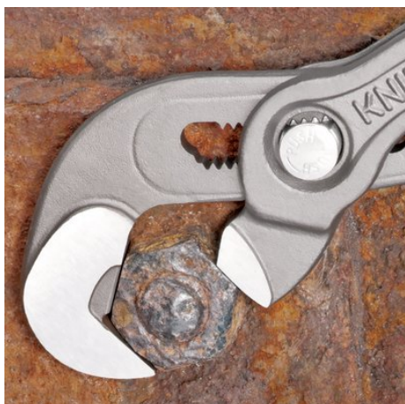
Arbete på rostig mutter med rundade kanter