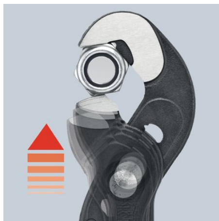
Finjustering med tryckknapp: snabb och komfortabel