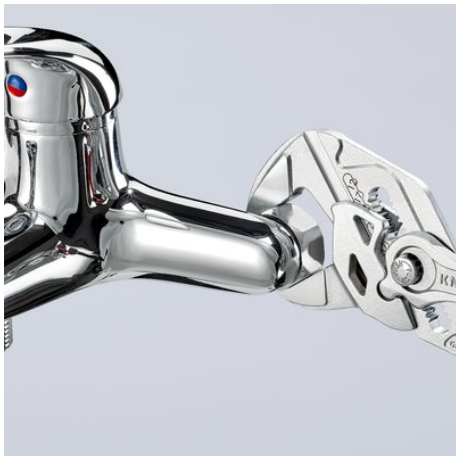
Arbeid på forkrommet armatur uten å skade overflaten