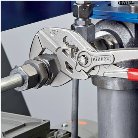
Ersätter en sats skruvnycklar, metriska och med tummått