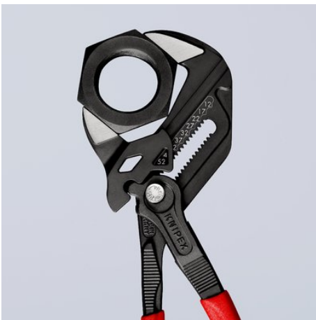
Schlüsselweite metrisch (Vorderseite) und zöllig (Rückseite) am Zangenkopf eingelast