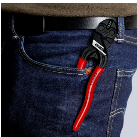
Compact, licht en altijd erbij

Onder voorbehoud van technische wijzigingen en vergissingen