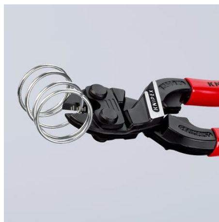
Krachtig tot in de punten