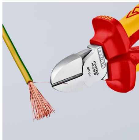
Keurige snede bij Cu-draden, ook aan de snijtoppen