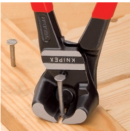
Bijna vlak afsnijden van bouten, nagels, etc.

Onder voorbehoud van technische wijzigingen en vergissingen