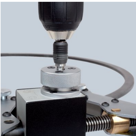
Machinaal of manueel te bedienen

Onder voorbehoud van technische wijzigingen en vergissingen