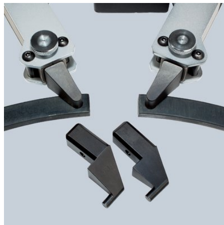
Vervangbare inzetstukken voor binnen- en buitenringen