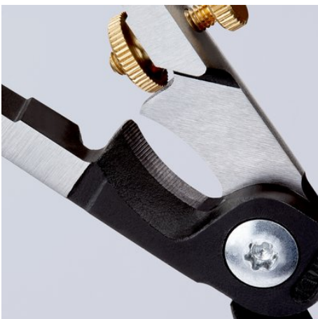
Indukčně kalený přesný břit