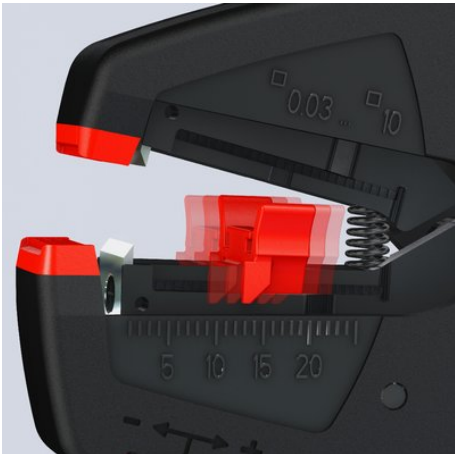
Opritor reglabil pe lungime