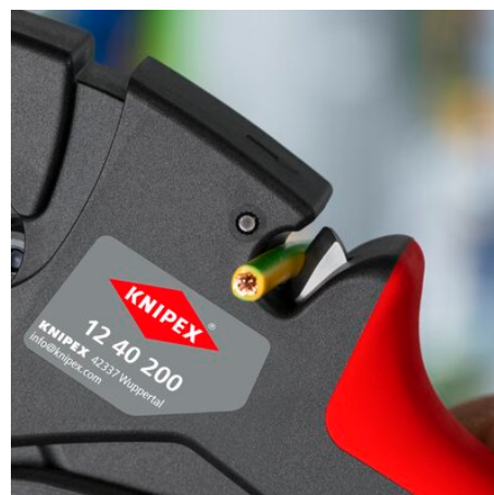
Integrierter Kabelschneider bis 10 mm 2 feindrähtig, 6mm 2 eindrähtig!