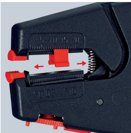
12 40 200: Verstelbare lengteaanslag

Onder voorbehoud van technische wijzigingen en vergissingen