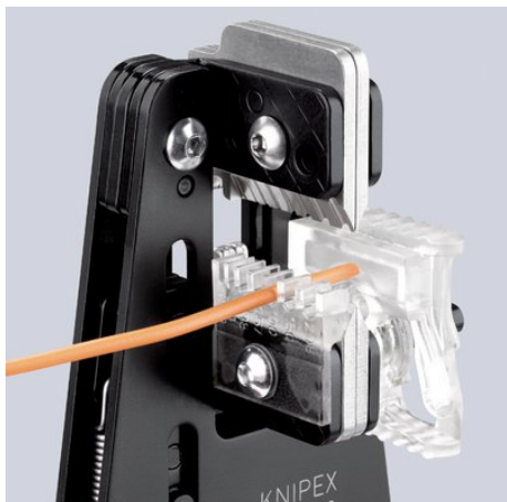
12 12 02 med kabelstyrning och längdstopp