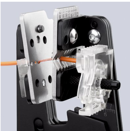
Tvarově se přizpůsobující odizolování díky precizním profilům nožů

Kapton® je registrovaná značka zboží E. I. du Pont de Nemours and Company/Radox® je registrovaná značka zboží Huber & Suhner AG