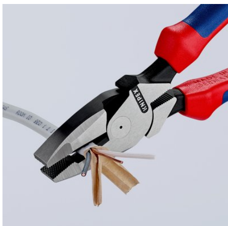
Långa skär för kapning av platt kabel