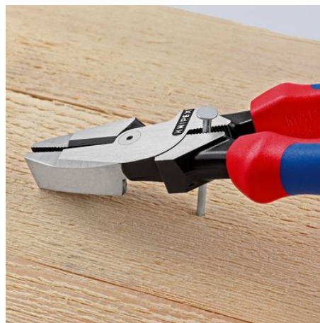
Grijpzone onder het scharnier voor krachtige wrikken