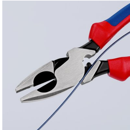
09 11/12 240: Kabelintrekhelp in de scharnierspleet