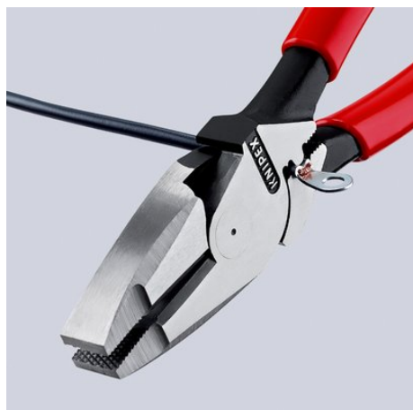
09 11/12 240: S univerzálním trnovým místem pro krimpování pod kloubem