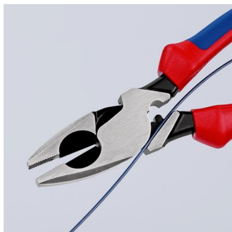
09 11/12 240: vtaňovací přípravek na kabely v mezeře kloubu