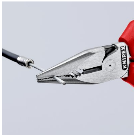
Gefreesde groef in de grijpzone