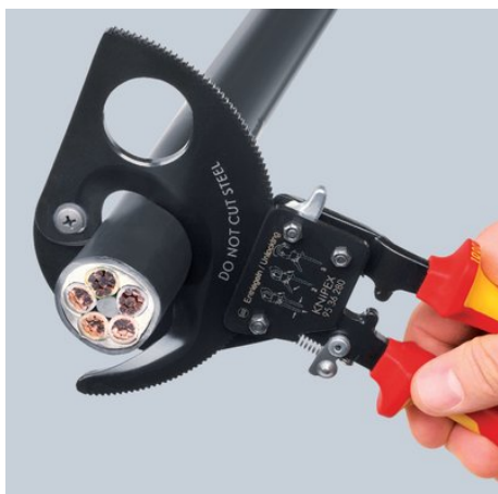
Principe du cliquet et entraînement par couronne dentée à 2 positions pour une coupe moins fatigante